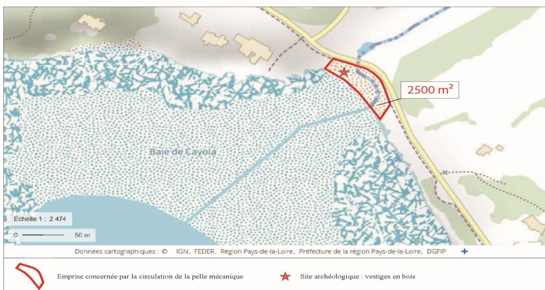
Annexe : Localisation du site archéologique et de l'emprise concernée par la circulation de la pelle mécanique sur le cordon de galets (source : fond de carte IGN)

Pour le préfet, par délégation Pour le directeur départemental des territoires et de la mer, L'adjoint à la cheffe du service mer et littoral,