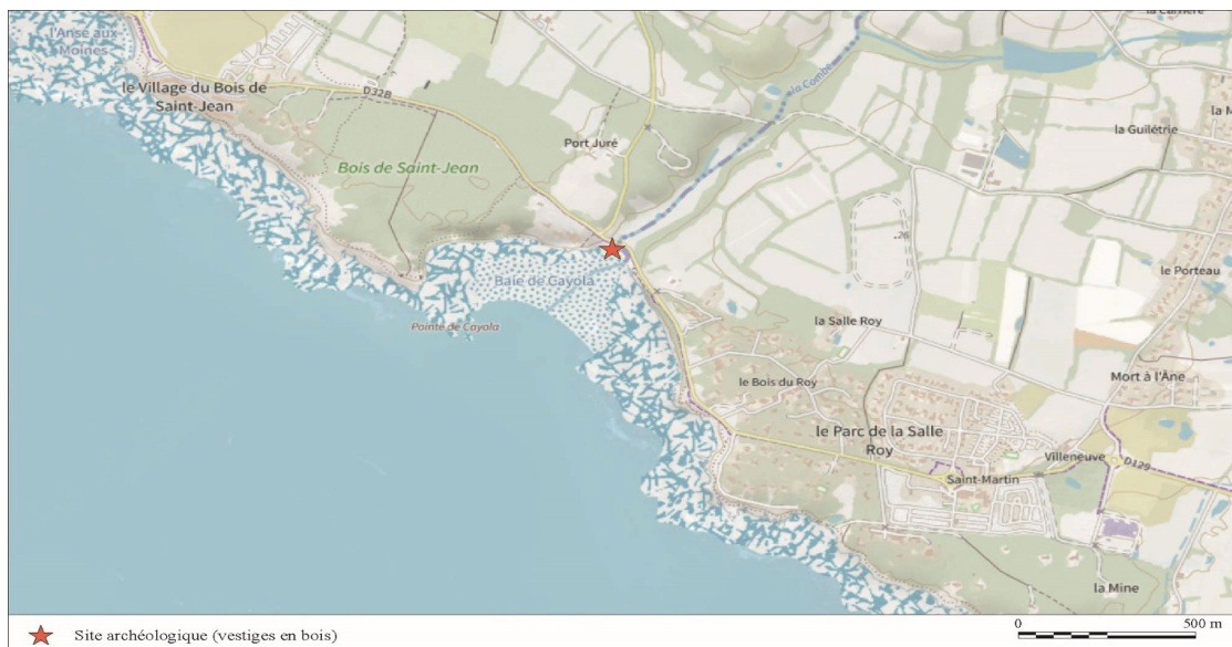
Annexe : Localisation du site archéologique matérialisé par des vestiges en bois signalés dès 1912 (source : fond de carte IGN)