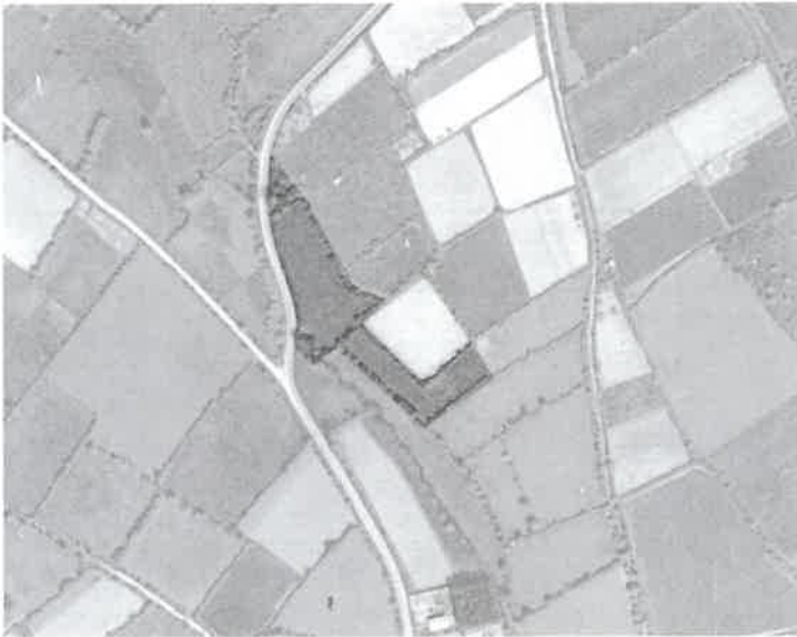
Les Essarts – Vue aérienne 1950/ 1965