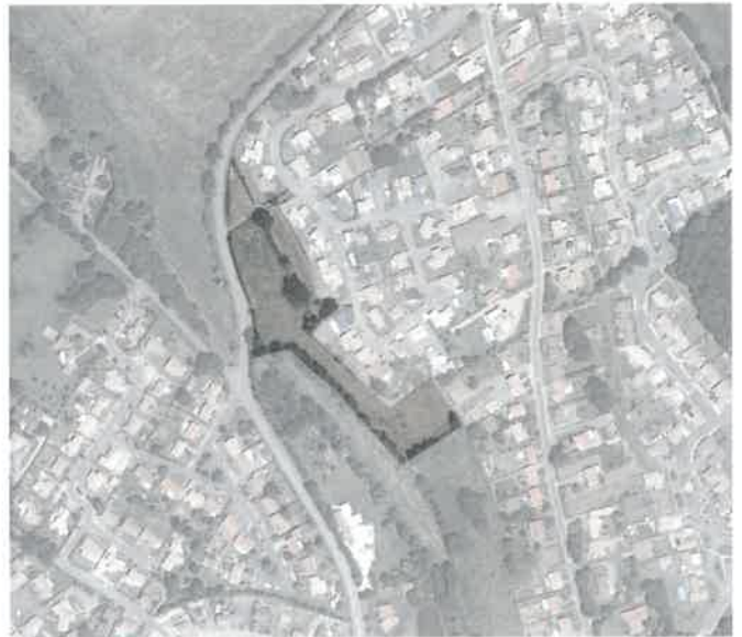
Les Essarts – Vue aérienne de nos jours