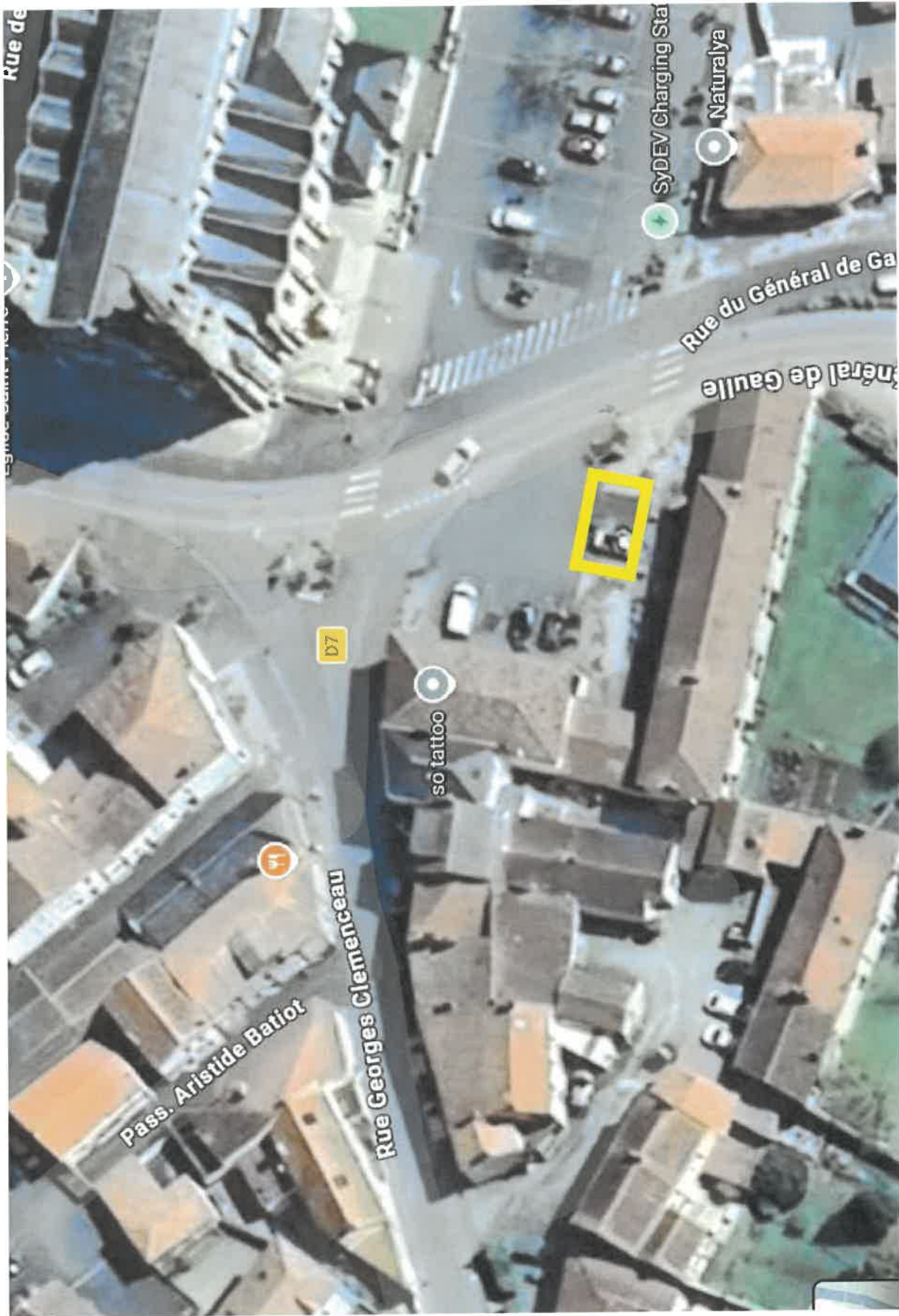
Occupation de 2 places de parking